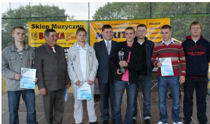
Puchar Wójta zdobyła drużyna GROM Malanów I

Tradycją stał się już organizowany corocznie podczas Dni Malanowa turniej o Puchar Wójta Gminy. Po raz pierwszy jednak rozgrywki odbyły się na nowo otwartym kompleksie boisk sportowych „Orlik 2012”. Do walki o trofeum stanęło aż osiem drużyn z terenu gminy Malanów, na co dzień będących członkami Gminnej Ligi Piłki Nożnej. O niesłabnącej popularności turnieju może świadczyć fakt, że Grom Malanów oraz Korona Dziadowice wystawiły do gry po dwa zespoły. W wyniku losowania drużyny zostały podzielone na grupy A i B, w których grały systemem „każdy z każdym”.