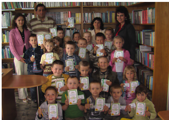
Nowi czytelnicy biblioteki publicznej