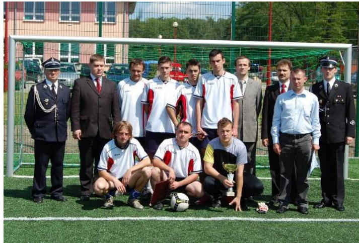
Zwycięzcy turnieju - OSP Słodków