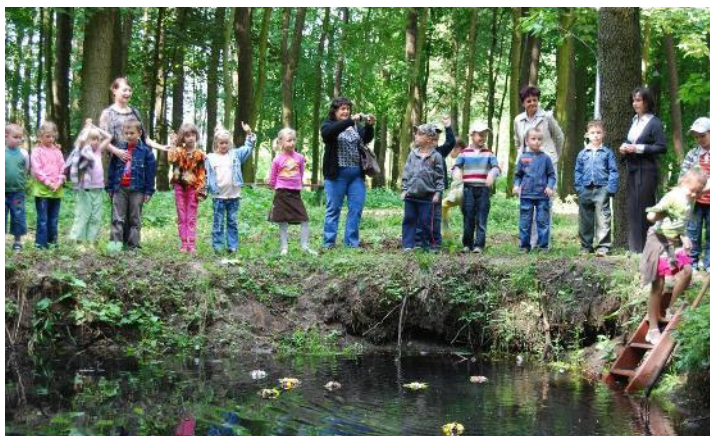
Pierwsze wianki na stawie