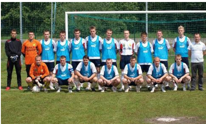
Drużyna KS Grom

Wręcz nieprawdopodobne wydają się rozstrzygnięcia ostatnich kolejek konińskiej B-klasy. Dzięki świetnej postawie wiosną oraz braku konsekwencji w szeregach rywali, Klub Sportowy „Grom” Malanów, który przed rozpoczęciem rundy rewanżowej miał w dorobku zaledwie 5 punktów i zajmował przedostatnie miejsce z dużą stratą do bezpośrednio wyprzedzających go rywali, ma szansę na zajęcie trzeciego miejsca na zakończenie rozgrywek. O dobrej grze Gromu przekonali się kolejni rywale zespołu z Malanowa, który po porażce 0-6