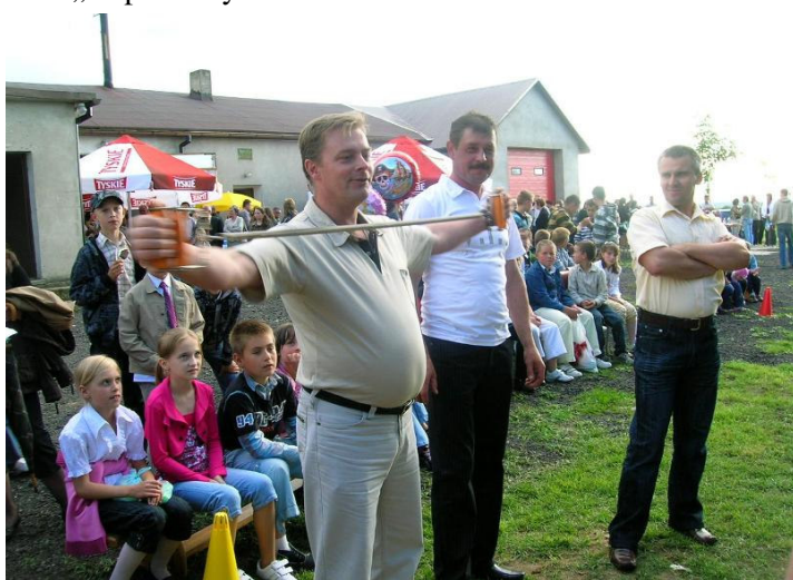
Rodzice chętnie uczestniczyli w zmaganiach sportowych

Część artystyczną zaprezentowały dzieci z miejscowej szkoły oraz zaproszone zespoły: „Perły i perełki” z Brudzewa, „Dziewięć melodyjek” z Kuny i grupa beat box „Hapaszamy” z Turku.