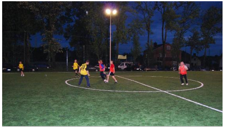
Drużyna Urzędu Gminy była nie do pokonania

Natomiast o godz. 20:00 na sztucznej murawie „Orlika” rozpoczął się turniej piłki nożnej, w którym udział wzięły 4 drużyny: Urząd Gminy Malanów, Nauczyciele z gminy Malanów, Samorządowcy z Malanowa i gościnnie Przedsiębiorstwo Robót Inżynierskich z Turku (PRI Turek) - wykonawca kompleksu boisk, na którym został zorganizowany turniej.