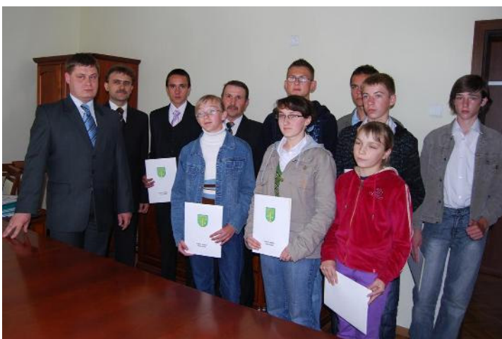
Młodzi sportowcy po otrzymaniu stypendiów

Stypendia sportowe przyznane zostały w dwóch kategoriach. Czterech zawodników otrzymało stypendium jednorazowe, natomiast dla sześciu najlepszych sportowców ufundowano stypendia miesięczne na okres dziesięciu miesięcy.