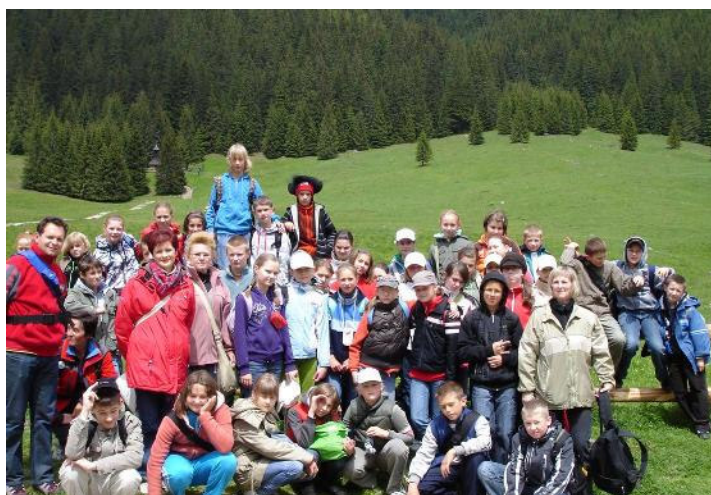
Na szlaku Doliny Kościeliskiej

Szóstoklasiści dotarli do Ustki, która położona jest u ujścia rzeki Słupi i jest jednym z najatrakcyjniejszych miejsc na wypoczynek nad morzem. Malownicze miasteczko portowe z czystą, piaszczystą plażą oraz