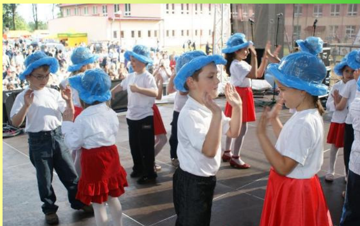
Występ malanowskich przedszkolaków

Gminne Centrum Kultury i Sportu oraz Urząd Gminy w Malanowie dołożyli wszelkich starań, aby czas spędzony na „Dniach Malanowa” obfitował w wydarzenia budzące zainteresowanie wśród uczestników jak i publiczności. Na scenie zaprezentowały się lokalne zespoły: „Tradycja”, „Jarzębinki”, „Tercet Malanowski 2+1” oraz „Chór Viribus Unitis” z Turku. Wspaniały popis swych artystycznych umiejętności zaprezentowali mali artyści ze Szkoły Podstawowej w Miłaczewie i z Gminnego Przedszkola w Malanowie.