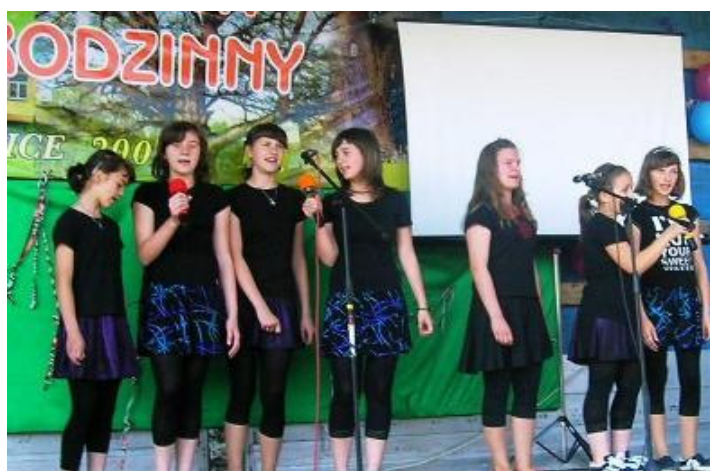
Uczennice z SP w Kotwasicach prezentują talenty wokalne