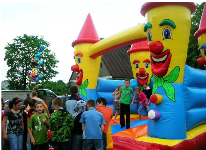
Dmuchany plac zabaw sprawił dzieciom wiele radości

N iedziela 7.06.2009r. to dla mieszkańców Kotwasic dzień wspólnej zabawy. Choć rozpoczęciu imprezy zagroziło załamanie pogody, w miarę upływu czasu roz pogodziło się zarówno niebo jak i nastroje zgromadzonych.