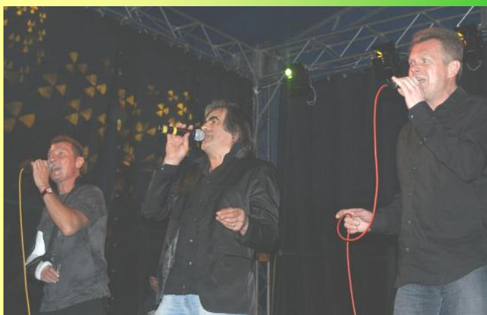
Koncert zespołu VOX