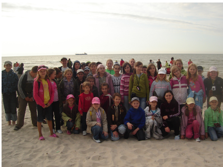
Wspólne zdjęcie nad brzegiem Bałtyku

W dniach od 1 do 6 czerwca 51 uczniów klas II – VI Szkoły Podstawowej w Miłaczewie przebywało na zielonej szkole w Łebie.