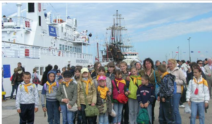
W Gdyni uczniowie zobaczyli fregatę "Dar Pomorza", okręt "Błyskawicę" i "Akwarium".

Kolejny dzień naszej "Zielonej szkoły" to Rąbka, gdzie meleksami przejechaliśmy do poniemieckich stanowisk wyrzutni rakiet, poszliśmy na ruchome wydmy i na plażę.