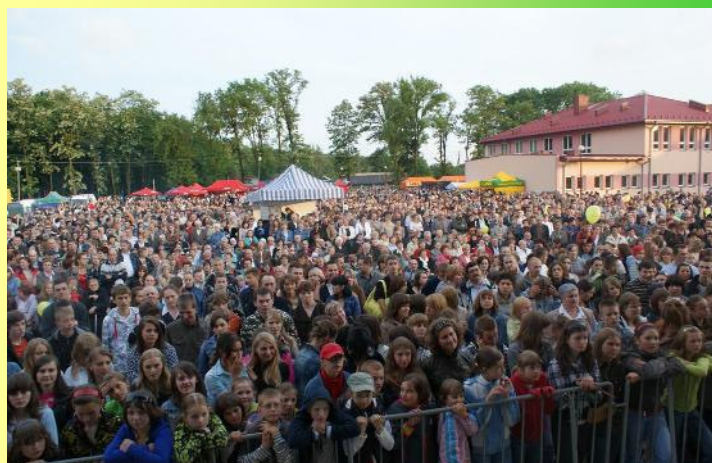
Galeria zdjęć dostępna jest na stronie www.malanow.pl

W ostatni majowy weekend na placu przy Gimnazjum w Malanowie bawiło się kilkanaście tysięcy osób podczas - siódmych już - „Dni Malanowa”. Chłód i pochmurne niebo nie przeszkodziły w dobrej zabawie, a frekwencja przeszła najśmielsze oczekiwania zarówno uczestników, jak i organizatorów. Z pewnością była to zasługa niezliczonych atrakcji, jakie czekały na wszystkich.