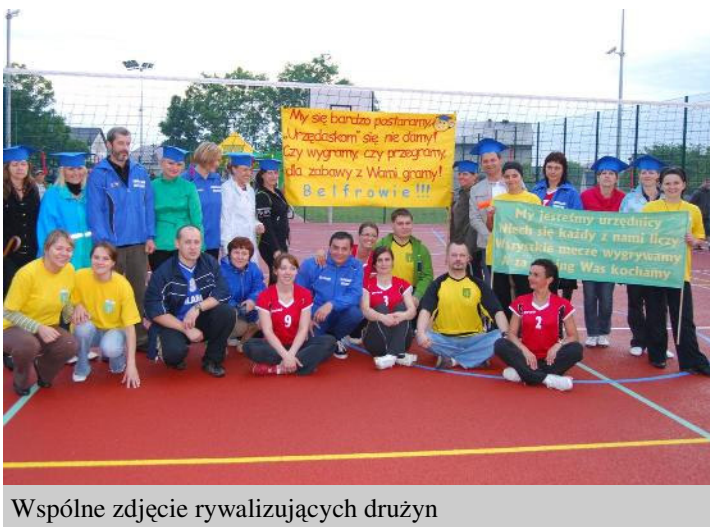
Wspólne zdjęcie rywalizujących drużyn

Drużyny te rywalizowały między sobą w jednej grupie, turniej rozgrywany był systemem każdy z każdym 2x7 minut.